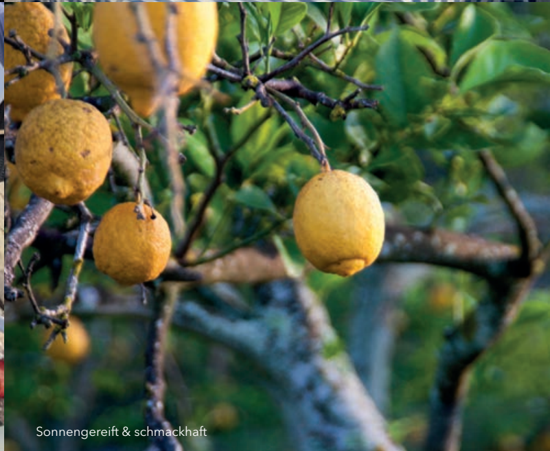
Sonnengereift & schmackhaft