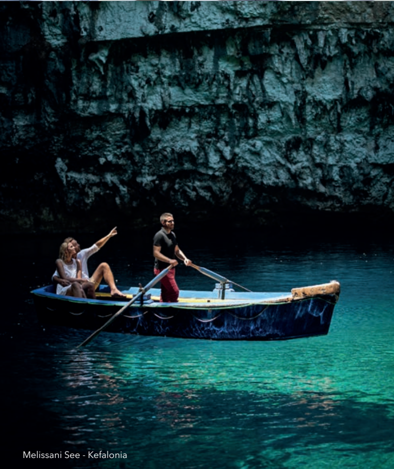
Melissani See - Kefalonia