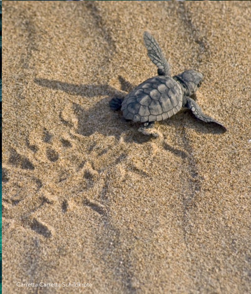
Carretta Carretta Schildkröte