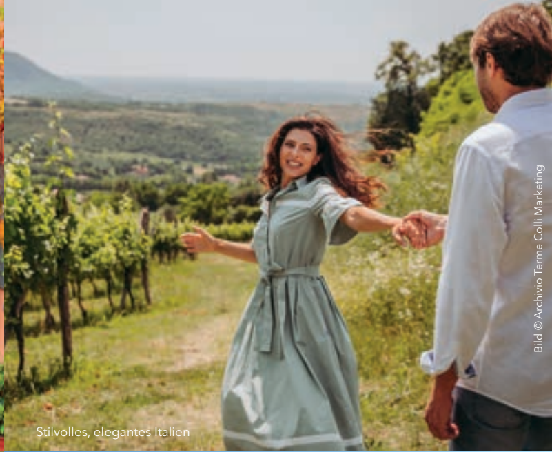
Stilvolles, elegantes Italien