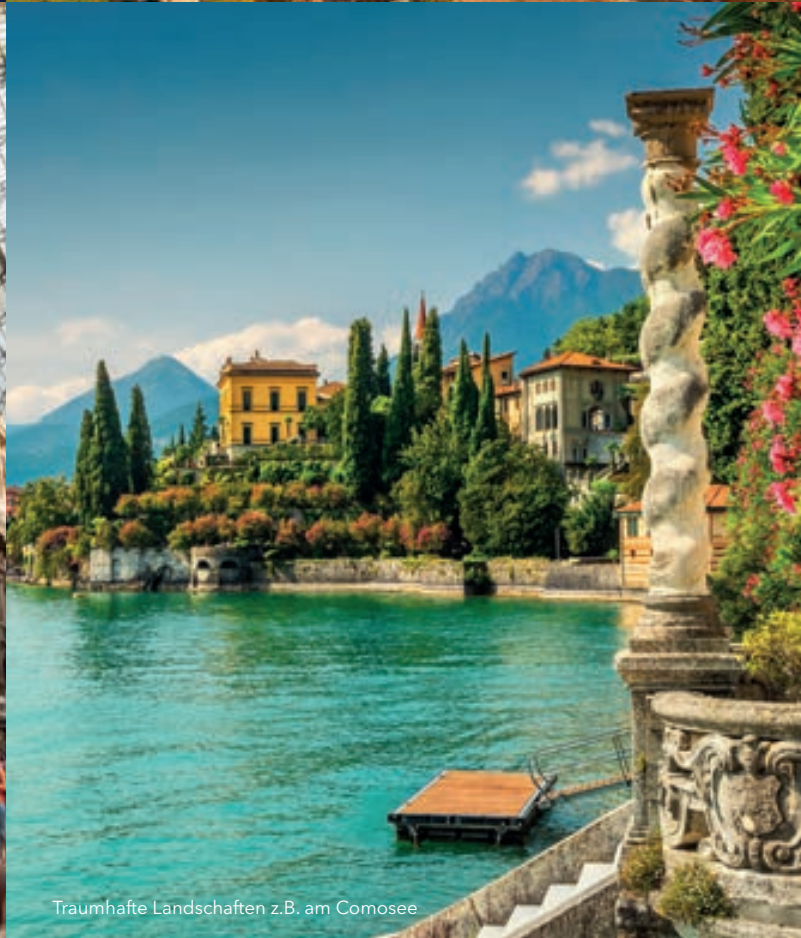
Traumhafte Landschaften z.B. am Comossee