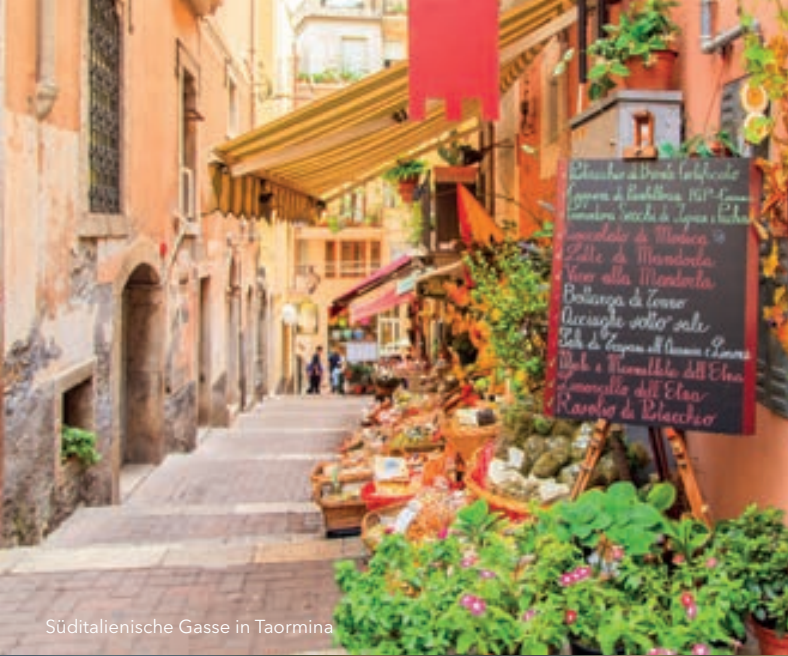
Südtaliesische Gasse in Taormina