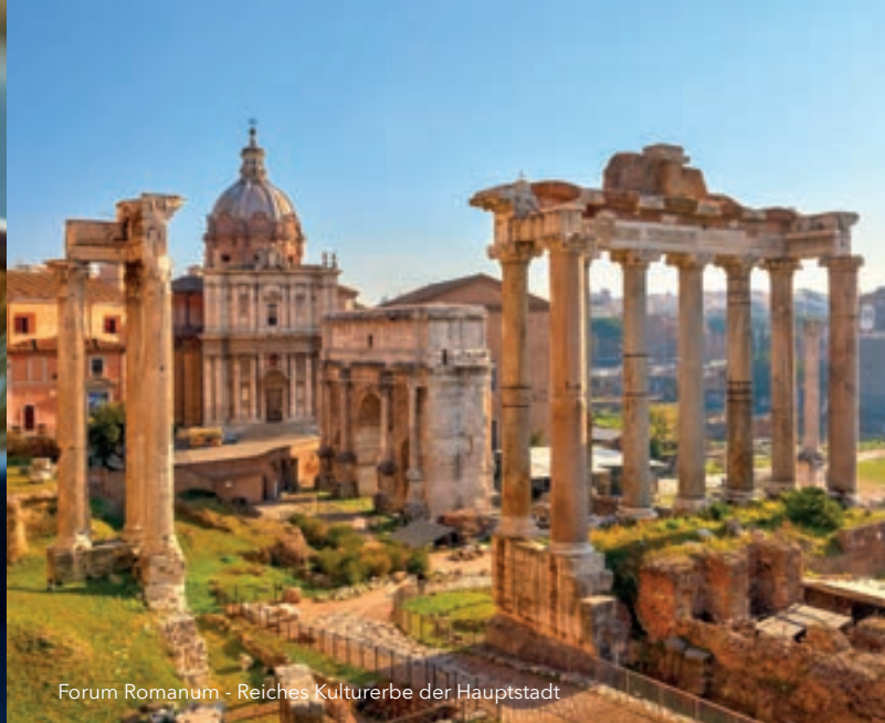
Forum Romanum - Reiches Kulturerbe der Hauptstadt