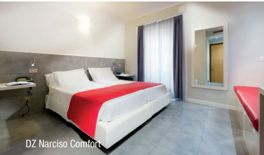
DZ Narciso Comfort