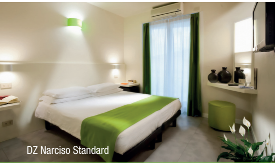
DZ Narciso Standard

Das vom Reiseführer „Michelin“ empfohlene Hotel Garden Sea**** gehört zu den führenden Hotels in Caorle. Die freundliche Atmosphäre, das ausgezeichnete Service und die gute Lage machen es zur TOP-Adresse bei Idealtours-Kundinnen.