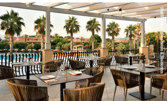
Einige der vielen Restaurants & Bars des Hotels